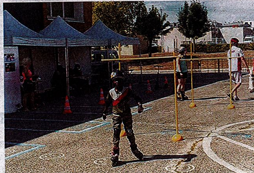
Les jeunes apprennent à s'équiper et à acquérir les bons réflexes au gré d'un circuit pédagogique.